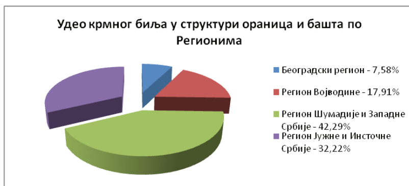
Графикон 2. Удео крмног биља у структури ораница и башта по Регионима, 2012. година (у %)