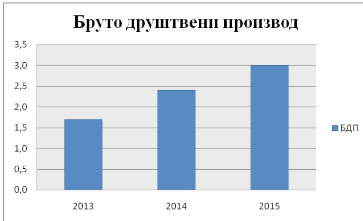
Графикон бр. 2: Кретање БДП-а у Русији у 2013,2014 и 2015 години.

Извор: http://www.gks.ru (Russian Federal State Statistics Service)[5]